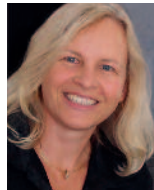
Christine Schott Redaktion

Tel.: 0711/75 91-340 mscheck@bitverlag.de