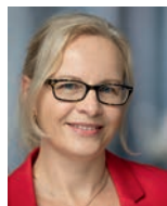
Christine Schott Redaktion

Tel.: 0711/75 91-340 mscheck@bitverlag.de